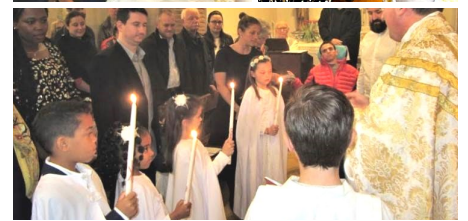
20-21/04 : Baptêmes et 1 eres communions pour Pâques