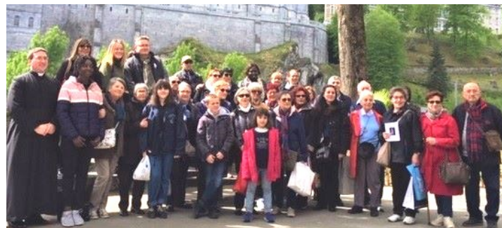
27-28-29/04 : Pèlerins de Saint-Paul à Lourdes